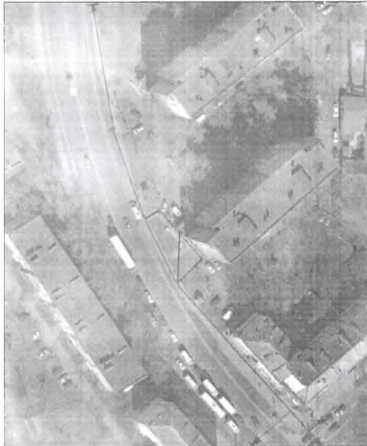
СХЕМА границы территории, прилегающей к медицинской организации ООО «Стоматологическая поликлиника «Самсон» (Московская обл., городской округ Орехово-Зуево, г.Орехово-Зуево, ул. Юбилейный проезд, д.2), на которой не допускается розничная продажа алкогольной продукции

Условные обозначения: —▶— — расстояние от входа в медицинскую организацию до границы прилегающей территории.